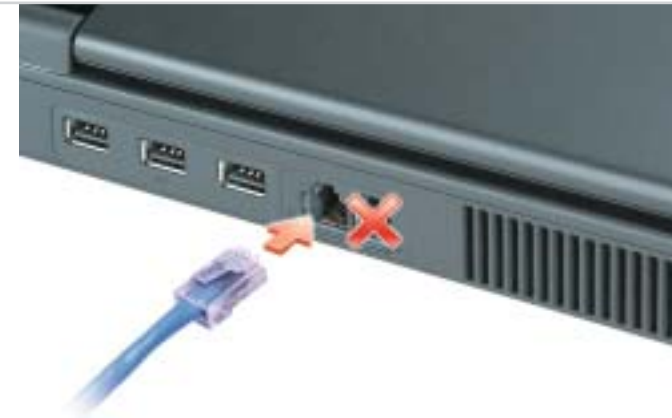
3 Network Réseau ネットワーク