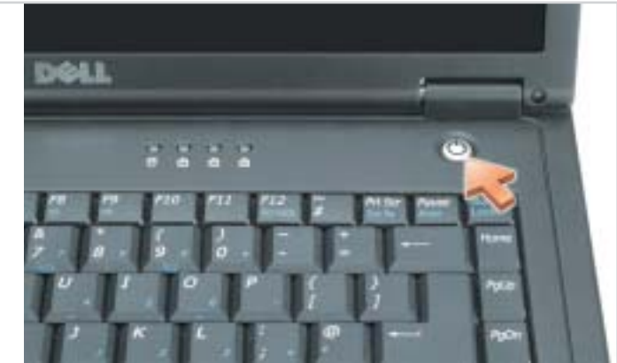
4 Power Button Bouton d'alimentation 電源ボタン