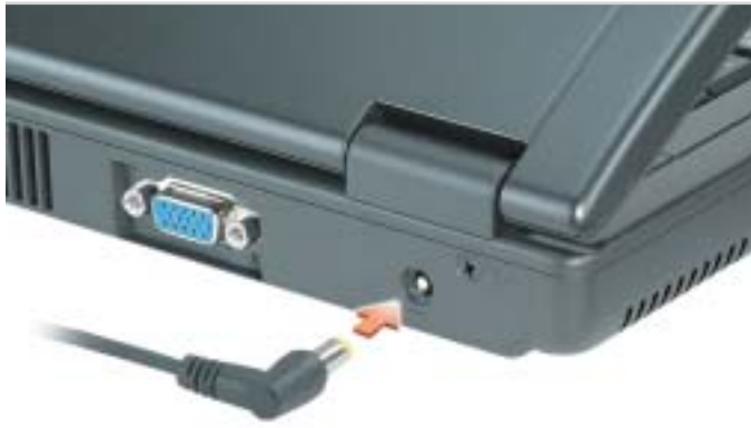
1 AC Adapter Adaptateur secteur AC アダプタ

Dell™ コンピュータをセットアップして使用する前に、『製品情報ガイド』の安全にお使いいただくための注意をよくお読みください。詳細な機能の一覧については、『オーナーズマニュアル』を参照してください。