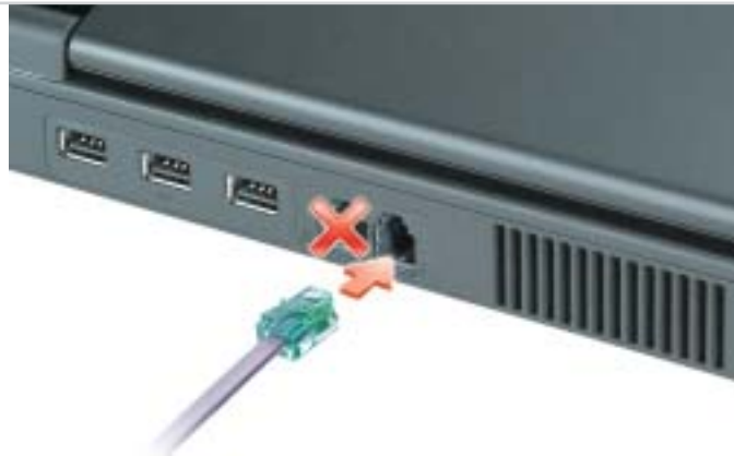
2 Modem Modem モデム